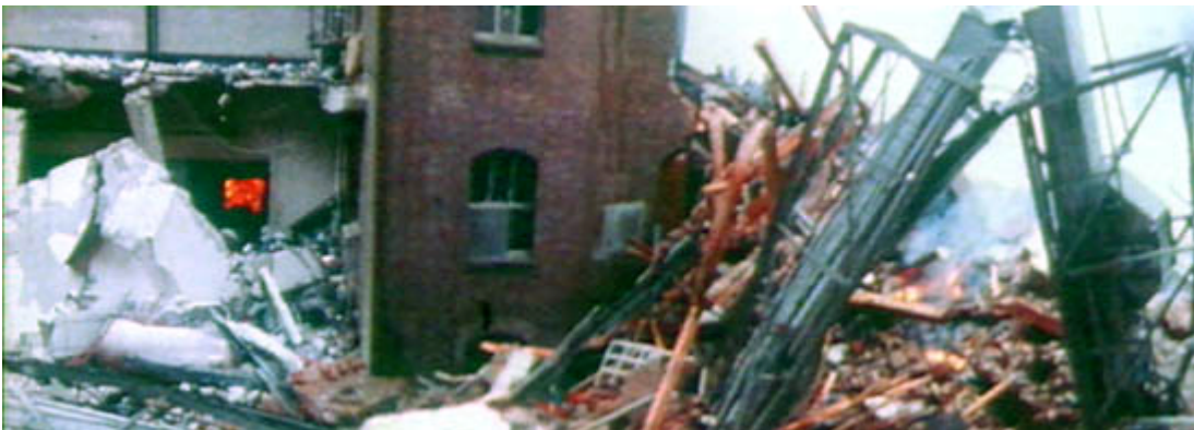
Die Bremer Rolandmühle 1979

14 Tote, 17 Verletzte und ein Sachschaden von über 100 Millionen Mark - das ist die Bilanz der größten Mehlstaubexplosion in der Geschichte der Bundesrepublik. Am 6. Februar 1979 löste ein kleines Feuer in der Bremer Rolandmühle die Katastrophe aus. In einer Kettenreaktion wirbelte jede Einzelexplosion wieder neuen Mehlstaub auf, der wiederum explodieren konnte. Ein ähnliches Unglück ereignete sich am 20. August 1997 im französischen Blaye.